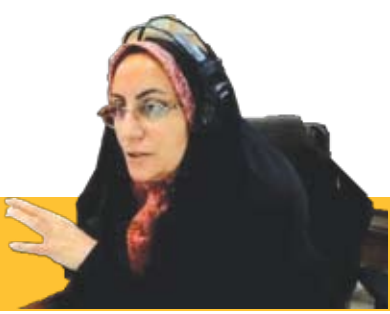
جشنواره پژواک فانوسی در راه مستندسازی رادیو