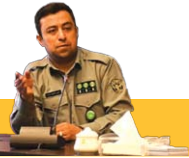
تجهیز محیط بانان آذربایجان شرقی به وسایل مدرن