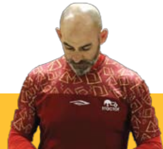
خمز مری متوسط لالیگایی