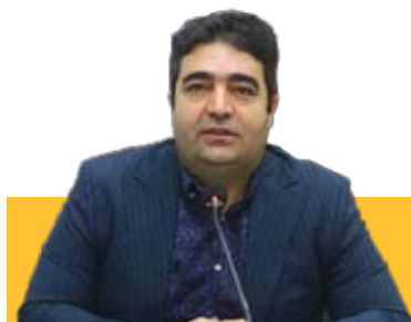
ضرورت تشویق بخش خصوصی آذربایجان شرقی جهت سرمایه گذاری در حوزه معادن

رئیس سازمان جهاد کشاورزی استان از افزایش تولیدات آذربایجان شرقی در دوره جدید خبر داد؛