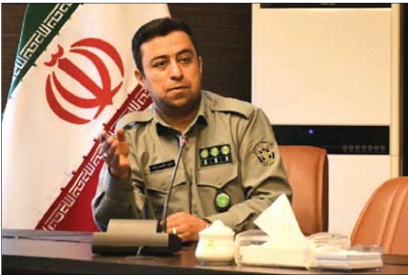
پروژه های سازندگی دولت مردمی با محوریت توسعه سطح هوشمندسازی مناطق تحت مدیریت استان، نوسازی پاسگاههای محیط بانان و ادارات محیط

عصر آزادی / سرویس شهرستاها: معاون توسعه مدیریت، حقوقی و منابع انسانی اداره کل حفاظت محیط زیست آذربایجان شرقی از تجهیز محیط بانان تحت مدیریت این مجموعه به وسایل و ابزارهای جدید و مدرن خبر داد.