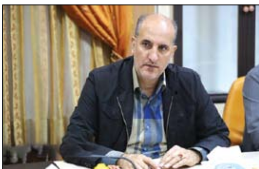
شرکت کننده یا حداکثر دو سال بعد از دانش آموختگی ثبت و دارای گواهی ثبت اختراع از مرجع رسمی باشد. سرپرست معاونت فرهنگی سازمان جهاد دانشگاهی آذربایجان شرقی، ادامه داد: همچنین در بخش طرح پژوهشی، طرح ارائه شده باید در زمان

دانشجویی شرکت کننده یا حداکثر دو سال بعد از دانش آموختگی به پایان رسیده باشد و دارای قرارداد و گواهی اتمام طرح و اعلام رضایت کارفرما برای ارائه در مسابقات باشد. در غیر این صورت شرکت کننده باید تعهدنامه عدم محرمانگی طرح را به دبیرخانه مسابقات ارائه نماید. وی تصریح کرد: این مسابقات بستری برای رشد و تقویت مهارت های ارتباطی، بانی و ایده پردازی در دانشجویان، کاربردی کردن پژوهش ها و تحقیقات دانشجویی، ترویج فرهنگ مطالعه و ترویج گفتمان علم است. کنعانی، با بیان اینکه دانشجویان تمامی مقاطع تحصیلی می توانند در این مسابقات شرکت کنند، تصریح کرد: بخش پایان نامه برای رقابت در مقاطع کارشناسی ارشد و دکتری طراحی شده است. وی با بیان اینکه مرحله کشوری این مسابقات پس از پایان مرحله مقدماتی استانی به صورت ملی اجرا خواهد شد افزود: دانشجویان دانشگاه های استان می توانند برای شرکت در بخش های مختلف این مسابقات می توانند برای کسب اطلاعات بیشتر با شماره ۳۳۳۲۱۱۲۰ - ۴۱ تماس گرفته و یا به معاونت فرهنگی سازمان جهاد دانشگاهی استان واقع در دانشگاه تبریز - ساختمان جهاد دانشگاهی مراجعه نمایند.