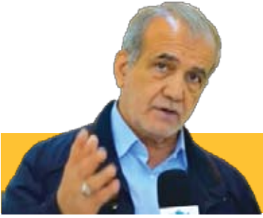
خطرناک ترین منکر تفرقه و اختلاف است