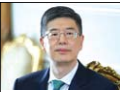
زونگ بی وو سفیر چین در ایران

چندی پیش از تبریز مرکز استان آذربایجان شرقی در ایران بازدید کردم، تاریخ و فرهنگ طولانی تبریز، مناظر طبیعی زیبا، مردم خونگرم و صمیمی و اقتصاد اجتماعی پر جنب و جوش تبریز تأثیر عمیقی بر من به جا گذاشت و اگرچه بیش از یک ماه است که تبریز کهن را ترک کرده ام اما، خاطرات زیبای تبریز همچنان در ذهنم باقی مانده است.