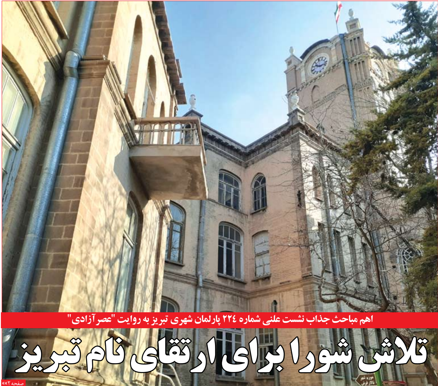
اهم مباحث جذاب نشست علنی شماره ۲۲۴ پارلمان شهری تبریز به روایت "عصر آزادی"