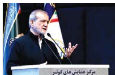
مرکز همایش‌های گولر

صورت می‌گیرد، حتی اگر جامعه اسلامی هم نباشد در هر جای کره خاکی ظلمی صورت گیرد، مسلمانان موظف در مقابل به آن ظلم هستند. اگر انسان در مقابل این ظلم سکوت کند باید در مسلمان بودن و حتی انسان بودن خود شک کند. رئیس‌جمهور در ادامه تلاش برای تحقق عدالت در کره خاکی و خدمت به مردم ایران را مهمترین دغدغه مسئولان کشور دانست و افزود: وقتی عدالت باشد، دعوا و تجاوزی وجود ندارد، تجاوز زمانی اتفاق می‌افتد که به داشته خود قانع نباشیم و برای تصاحب حق دیگران شروع به تجاوز می‌کنیم. پزشک‌ان اظهار داشت: آموزه‌های دینی به ما می‌گویند که باید بین «مردم» براساس حق و عدالت حکمرانی شود، بین همه «مردم» نه بین یک دسته، قوم، این گروه و یا آن گروه. اما اگر تاج‌های نفس باشیم به ضلالت کشیده خواهیم شد و هیچکس نمی‌خواهد که به ضلالت کشیده شود؛ نمی‌خواهیم در ضلالت بمانیم و تابع هوای نفس خود باشیم یعنی مال من، پول من، بیست من، قوم و خویش من، جناح من، حزب و دسته من، بلکه باید فقط پیگیر حق باشیم، ما باید این نگاه و باور را در جامعه و منطقه خود پیگیری کنیم.