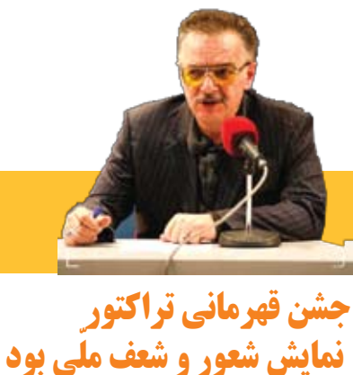
جشن قهرمانی تراکتور نمایش شعور و شرف ملی بود