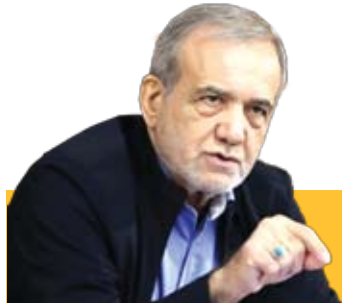
پیام سیاست خارجی دولت چهاردهم از طرف غرب پذیرفته نشد

همایش نقش داوری حرفه‌ای در جایگزین‌های قضایی در تبریز به کار خود پایان داد؛