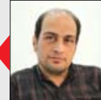
عصر آزادی / شهرام صادق زاده

در روزهای اخیر، شماری از اصناف و کسبه در تهران و چند شهر کشور در واکنش به فشارهای اقتصادی و نوسانات بازار، تجمعات اعتراضی برگزار کردند که محور اصلی این تجمعات، مطالبات صنفی و اقتصادی بود، به طوری که معترضان خواستار رسیدگی به مشکلات معیشتی، ثبات بازار و کاهش فشارهای ناشی از افزایش هزینه‌ها شدند.