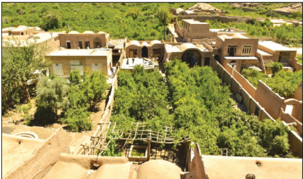
آبگرماتاشکزار، شهرستان اشکذر، یزد

شهر یزد، محله فهادان، کوچه شیخ احمد به شماره ۳۳۲۱۵ مورخ ۱۲/۸/۹۹.