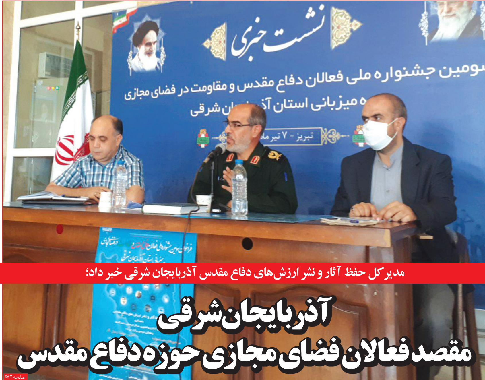
مدیر کل حفظ آثار و نشر ارزش‌های دفاع مقدس آذربایجان شرقی خبر داد؛