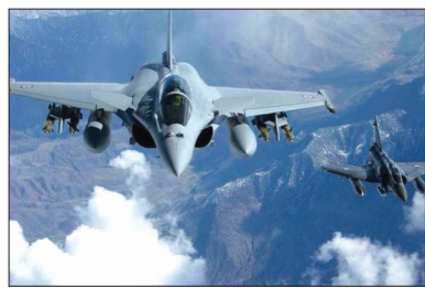
عملیات نظامی در صنعا یا هر شهر دیگر یمن انجام نداده و گزارش‌های مبنی بر هدف قرار دادن مقر یک لشکر زرهی در صنعا خلاف واقعیت است.

های صعد، مآرب و حجة بمباران کرده است. همچنین شورای عالی سیاسی یمن روز گذشته (چهارشنبه) با استیصال از تلاش‌های عمان برای کاهش رنج‌های مردم این کشور برای مذاکرات آتی با ائتلاف سعودی سه اصل تعیین کرد.