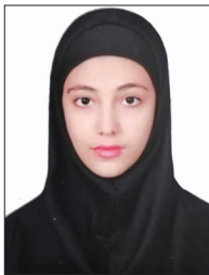
نویسنده: مترجم: مینا محمدخانی

پیشاهنگ شخصی و کامپیوتر های آینده که الهام گرفته شده از کهکشان هستند!د کوچکی یک سسکه ی پنی(همه ی این ها به خاطر پردازندی سینتازاست.