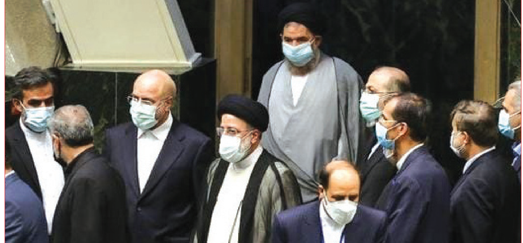
«عصر آزادی» از فراموشی دولت جدید از نخبگان آذربایجانی در کابینه سیزدهم گزارش می دهد؛