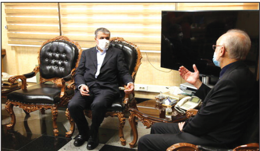
کنند، نیازمند فعالیت بیش از پیش سازمان‌های موثر و تاثیرگذار همچون سازمان انرژی اتمی به عنوان محرک توسعه فناوری هستند، اظهار

وی با اشاره به پروژه‌های در شرف اتمام سازمان انرژی اتمی از جمله ساخت بیمارستان یون درمانی ابرار امیدواری کرد که این پروژه‌ها در یکسال آینده به بهره‌برداری برسند.