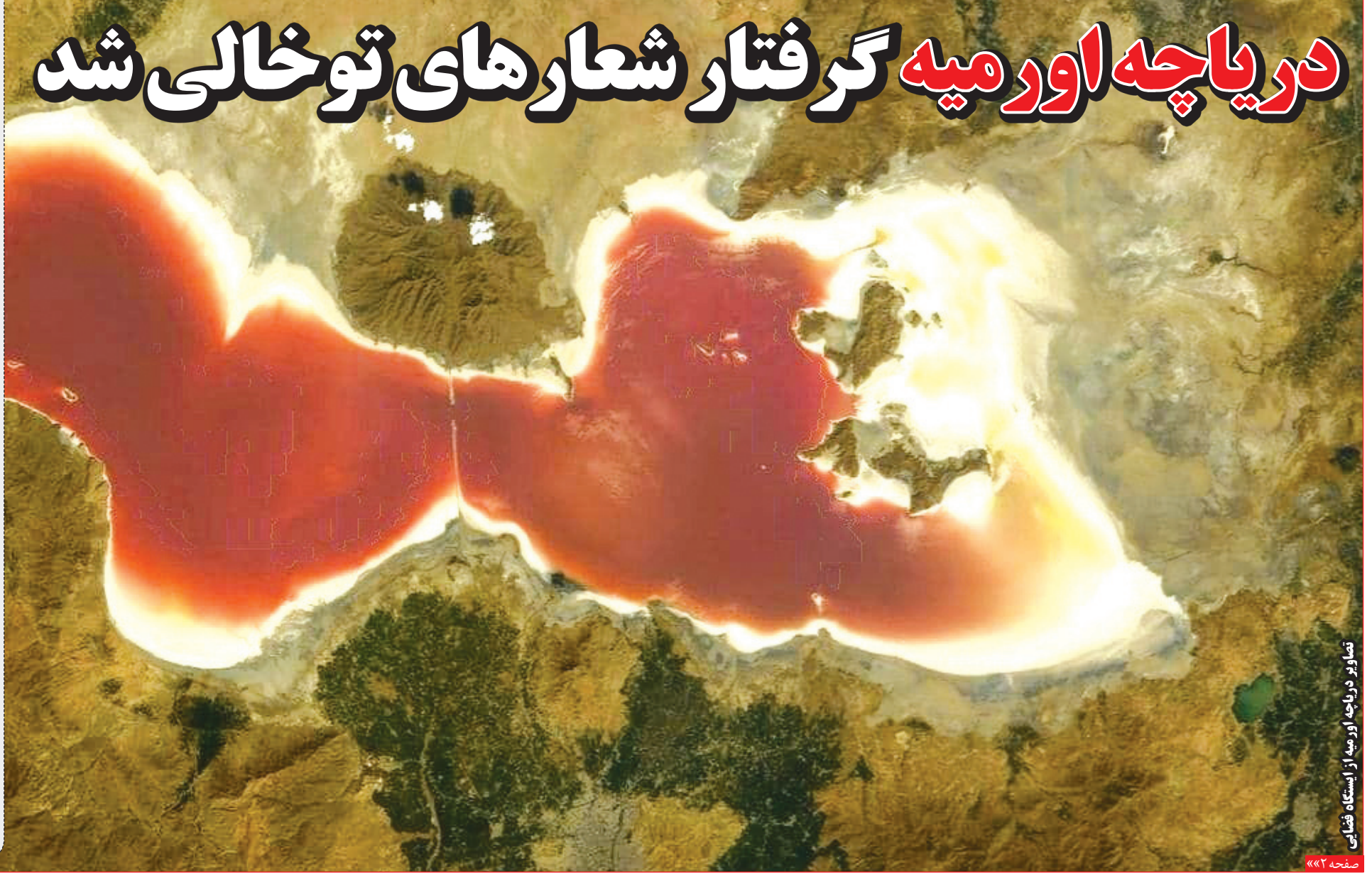
تصاویر دریاچه اورمیه از استگاه فضایی