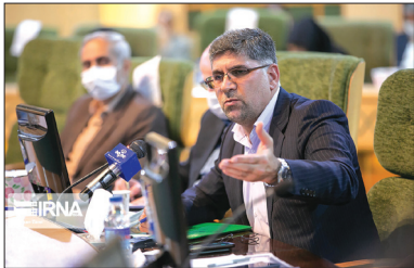
اسلام را برپاید.