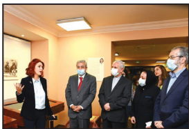
ایران در آن کشور بود.

به گزارش ایرنا از سفارت جمهوری اسلامی ایران در ارمنستان، در آستانه سی‌امین سالگرد برقراری روابط دیپلماتیک ایران و ارمنستان موزه ماتناداران ایروان شاهد برگزاری رونمایی از جلد پنجم کتاب فرامین فارسی ماتناداران و هنر قاجار با همکاری سفارت