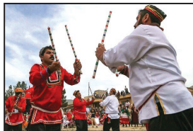
یچنورد برگزار می‌شود.

سرپرست اداره کل میراث فرهنگی، گردشگری و صنایع دستی خراسان شمالی گفت: با توجه به برنامه‌ریزی دبیرخانه ستاد اجرایی خدمات سفر، جشن نوروزگاه با مشارکت کشور قزاقستان سال ۱۴۰۱ در