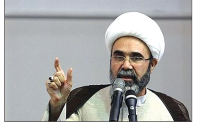
رئیس جدید شورای هماهنگی تبلیغات اسلامی