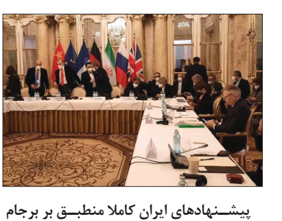
پیشنهادهای ایران کاملاً منطبق بر برجام است

هر چند رویکرد مذاکره ای هیات ایران از روز اول تعاملی و همراه با انعطاف لازم بود، اما متأسفانه در مقابل سه کشور اروپایی از اختیار تصمیم گیری بالایی در وین برخوردار نیستند و ضمناً دائماً دغدغه راضی کردن هیات آمریکایی و هماهنگ کردن مواضعشان با هیات آمریکایی را دارند. این در حالی است که این گفت و گوها میان ایران و ۴+۱ و نه ایران و آمریکا (که اساساً عضو برجام نیست) در حال انجام است اما این رویکرد اروپایی ها روند پیشرفت گفت و گوها را با چالش روبرو کرده است.