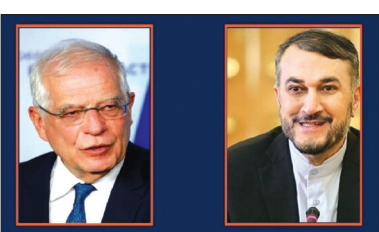
کمک به حل مشکل اعلام کرد.

رییس دستگاه سیاست خارجی کشورمان تاکید کرد: غرب هم باید ابتکار عمل واقعی خود را در خاتمه دادن به تحریم ها ارائه و به تکرار شعارهای قبلی و نقض حقوق و منافع ملت ایران پایان دهد. وی افزود: ما معتقدیم دستیابی به توافق خوب در دسترس است اما لازمه آن تغییر رویکرد برخی طرفها از ادبیات تهدید به ادبیات همکاری، احترام