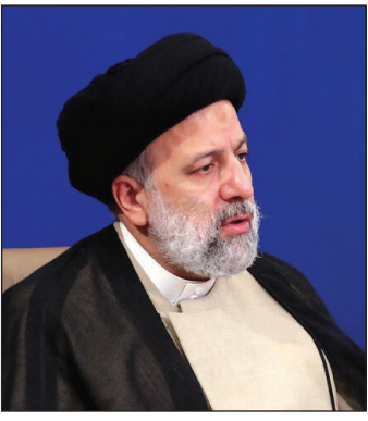
آیت‌الله ریسی در جلسه ستاد ملی