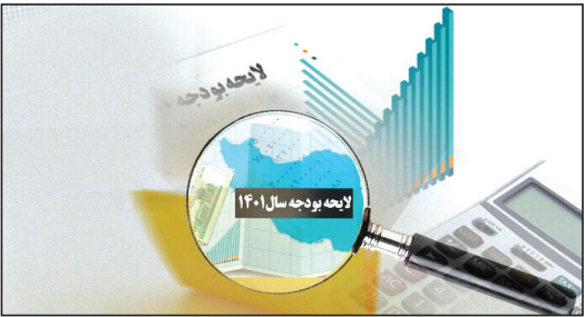
اصلاح ساختار بودجه است. شهبازی خاطر نشان کرد: طی ماههای اخیر بیشترین سعی و تلاش دولت آیتالله رئیسی توجه به مساله تولید و

عضو کمیسیون برنامه و بودجه مجلس گفت: لایحه بودجه ۱۴۰۱ ارائه شده توسط دولت در راستای اصلاحات ساختاری بوده است و در صورت تحقق می تواند بسیاری از مشکلات ساختاری اقتصاد کشور را برطرف کند.