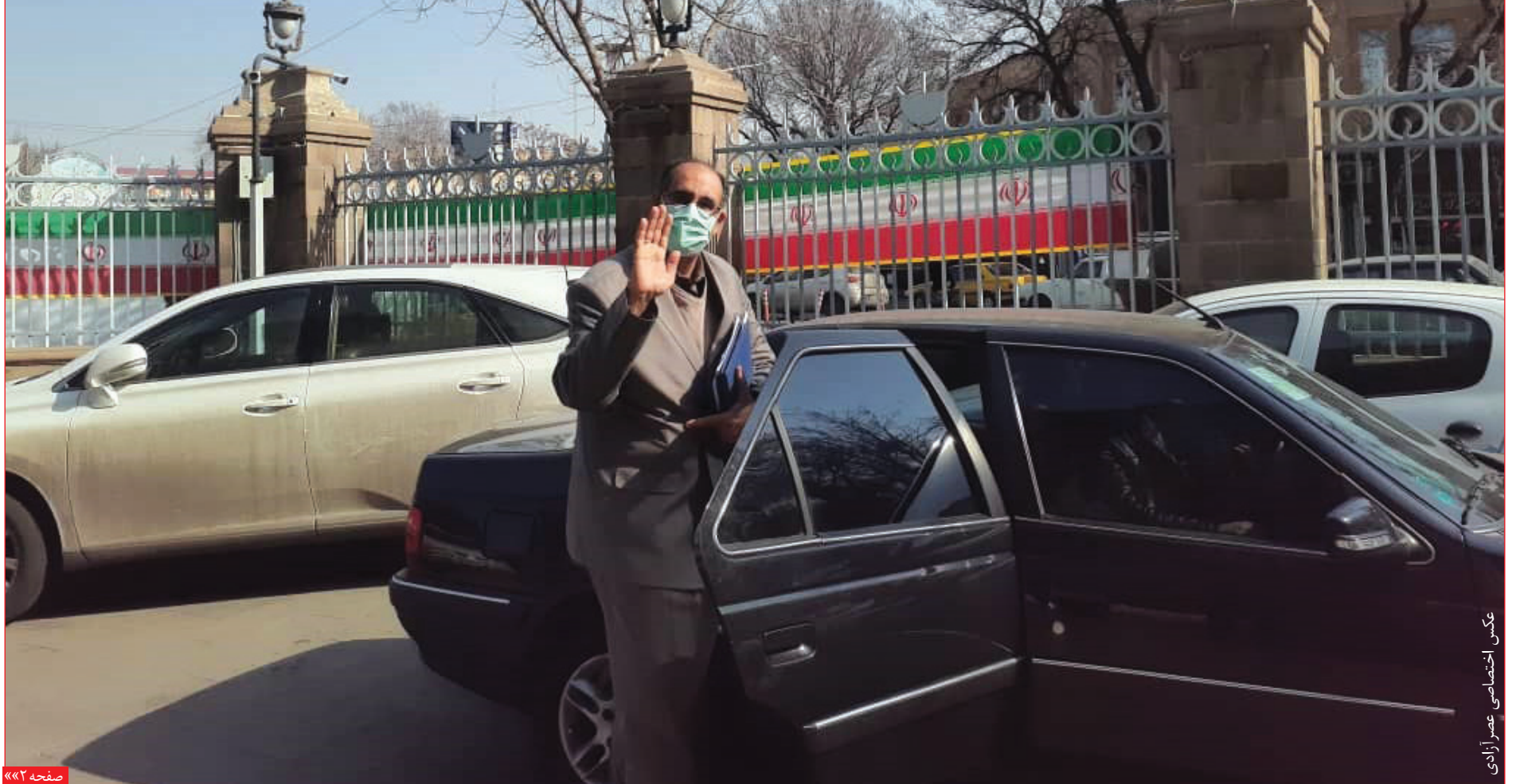
عکس اختصاصی عصر آزادی