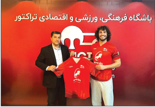
باشگاه فرهنگی، ورزشی و اقتصادی تراکتور