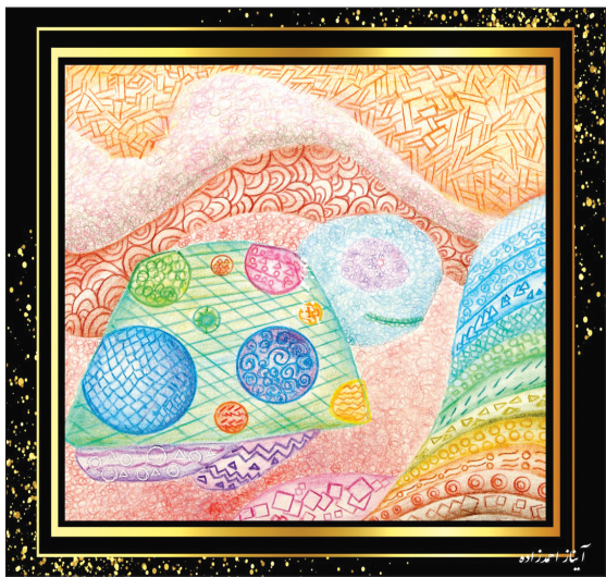
تابلو از زنده یاد آبناز احمدزاده