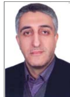
تهیه و تنظیم: کریم شعبی کارشناس ارشد مدیریت استراتژیک تعریف آینده پژوهی