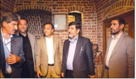
عصر آزادی / سرویس فرهنگی: اولین تجارتخانه ثبت شده ملی شمالغرب کشور با حضور معاون سیاسی، امنیتی و اجتماعی استاندار آذربایجان شرقی و مدیر کل میراث فرهنگی، صنایع دستی و گردشگری استان افتتاح گردید...

بازگشایی اولین تجارت خانه ثبت ملی شده آذربایجان شرقی