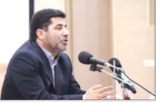
عصر آزادی / سرویس شهرستانها: رئیس سازمان جهاد کشاورزی آذربایجان شرقی گفت: بار اصلی اجرای طرح مردمی سازی و توزیع عادلانه بارانه ها بر دوش بخش کشاورزی، خصوصا مرغداران و دامپروران است...

رئیس سازمان جهاد کشاورزی استان تاکید کرد: ۱۰ درصد تخم مرغ کشور در آذربایجان شرقی تولید می شود