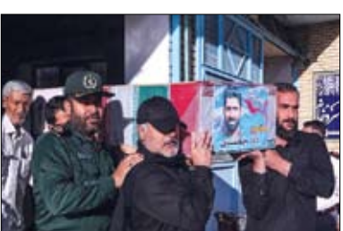
به گزارش ایسنا، شبکه کان رژیم صهیونیستی اعلام کرد که در رژیم صهیونیستی هراس از این وجود دارد که ایران بخواهد انتقام ترور داوود جعفری افسر سپاه پاسداران را بگیرد؛ چرا که حضور فرماندهان سپاه در تشییع پیکر این شهید، جایگاه و مقام آن را در سپاه نشان داد.

اسرائیل که در خارج اقامت دارند را در کنار امنیت مقامات سابق موساد افزایش خواهد داد. به گزارش ایسنا، روابط عمومی کل سپاه پاسداران انقلاب اسلامی هفته گذشته در اطلاعیه ای اعلام کرد: صبح روز سه شنبه ۱۱ آذر پاسدار رشید اسلام سرهنگ داوود جعفری از مستشاران نیروی هوافضای سپاه پاسداران انقلاب اسلامی در سوریه، توسط ایادی رژیم صهیونیستی با انفجار بمب کنار جاده ای در حوالی دمشق به شهادت رسید. در این اطلاعیه همچنین تاکید شد که «بی تردید، رژیم جعلی و جنایتکار صهیونیستی پاسخ این جنایت را دریافت خواهد کرد».