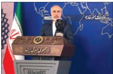
سخنگوی وزارت امور خارجه در نشست خبری: