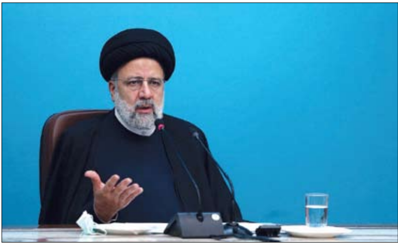
عضو کمیسیون اقتصادی مجلس: