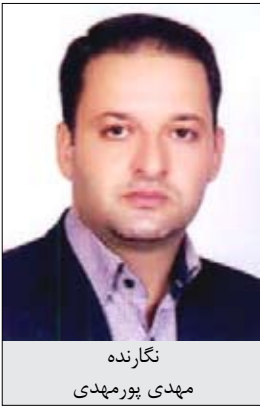
نگارنده مهدی پورمهدی