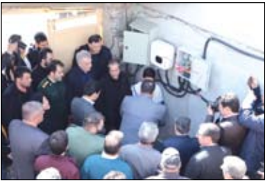
مدیرکل دفتر توسعه سامانه‌های مقیاس کوچک

سازمان انرژی‌های تجدیدپذیر وزارت نیرو (ساتبا) از آغاز طرح واگذاری و بهره برداری از ۲ هزار سامانه خورشیدی تولید برق پنج کیلوواتی در آذربایجان شرقی خبرداد.