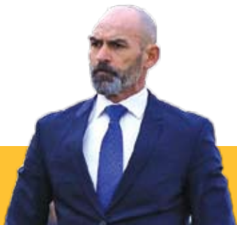
زمان ورود خمز به تبریز