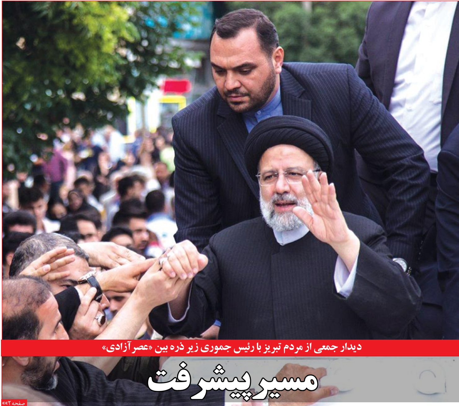
دیدار جمعی از مردم تبریز با رئیس جمهوری زیر ذره بین «عصر آزادی»