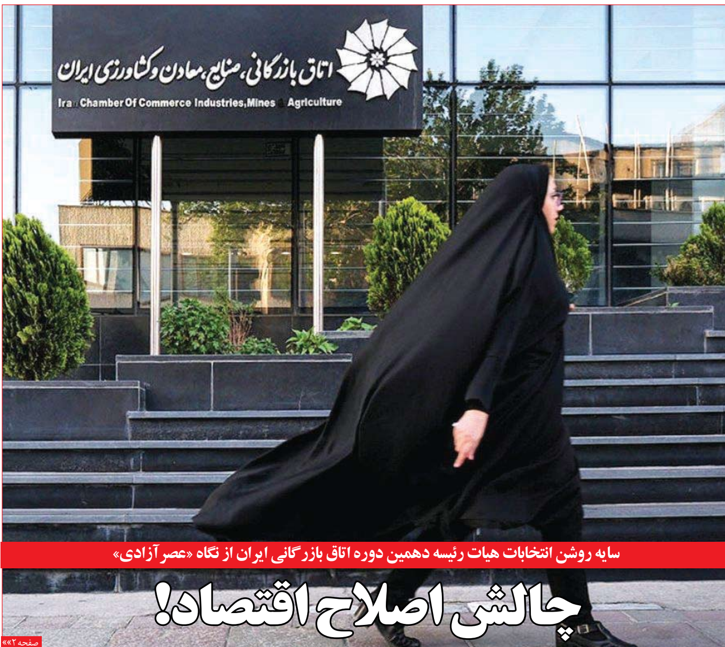
سایه روشن انتخابات هیات رئیسه دهمین دوره اتاق بازرگانی ایران از نگاه «عصر آزادی»