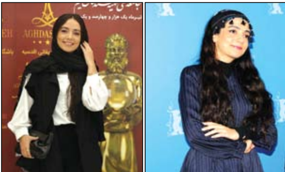
TODAY در ایتالیا، جشنواره بین المللی فیلم «منا» MENA در هلند، ششمین دوره جشنواره بین المللی فیلم «زنان» BWFF در لبنان و

دهمین دوره جشنواره بین المللی فیلم «فولکس» FOLCS در آمریکا نیز بوده است. «خانه خاموش»، «روز سیب»، «دروازه رؤیاهای» و «دلبنده» از جمله آثار او در حوزه تهیه کنندگی است.