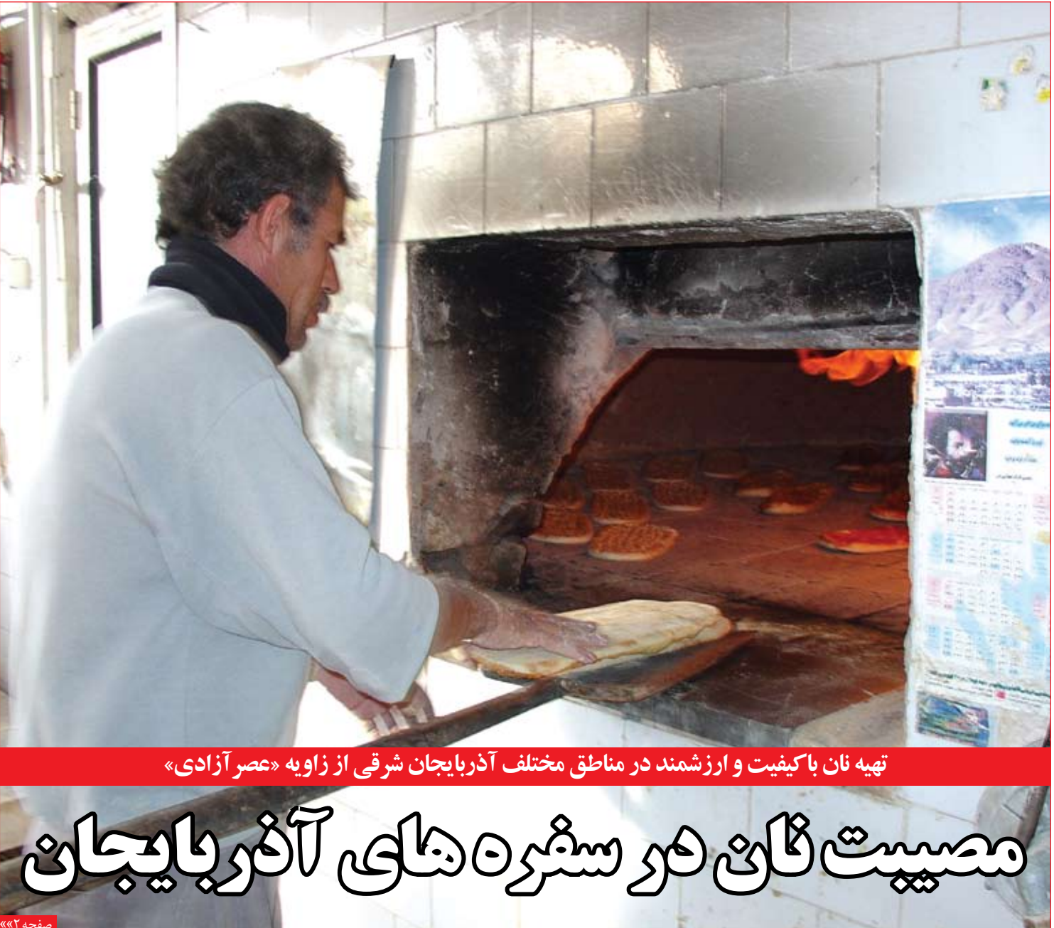
تهیه نان با کیفیت و ارزشمند در مناطق مختلف آذربایجان شرقی از زاویه «عصر آزادی»