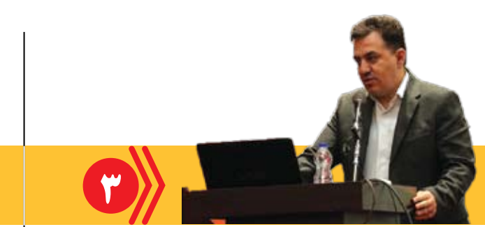
شهرداری تبریز عضو فعال در برگزاری کنگره ملی بزرگداشت ۱۰ هزار شهید آذربایجان شرقی