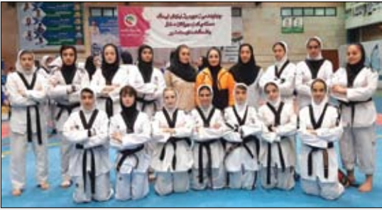
عصرآزادی / سرویس ورزشی: تیم دختران تکواندو مس سونگون صدرنشین مسابقات لیگ نوجوانان کشور در گروه خود شد...