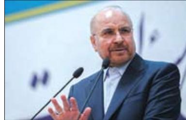
رئیس مجلس شورای اسلامی گفت: برای ناآرامی های سال گذشته اگر علوم انسانی یا فقه حکومتی رشد کافی داشت با آن را جدی گرفته بودیم ناآرامی های سال قبل رخ نمی داد.