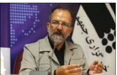
عضو کمیسیون انرژی مجلس: