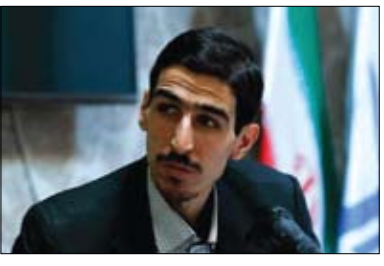
عضو کمیسیون انرژی مجلس:

برخی میادین مشترک انرژی دو کشور هم مذاکراتی صورت گرفته و به توافقاتی دست یافته اند. پیشتر نیز در سفر اواخر خرداد ماه آیت الله سید ابراهیم رئیسی رئیس جمهور کشورمان به سه کشور آمریکای لاتین، علاوه بر قراردادهای احداث پتروپالایشگاه های مشترک با ونزوئلا، قرارداد صادرات بنزین و فرآورده های نفتی به این کشور نیز به امضا رسید. مزیت بزرگ در بازسازی برای نفت ایران در آمریکای لاتین این است که افزون بر صادرات نفت بدون تخفیف های مرسوم در شرایط تحریم، فرآورده های نفتی تولید شده نیز در همان منطقه به فروش می رسد که درآمد ارزی بیشتری برای کشور به دنبال خواهد داشت. طی ۲۰ ماه گذشته (سال ۱۴۰۰) تنها ۶۰۰ میلیون دلار بود. دولت سیزدهم به دنبال احیای فرصت های بین المللی برای ایران است