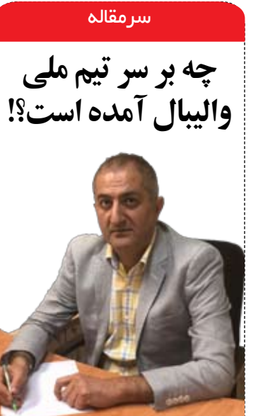
در مصاحبه معاون نظارت، حقوقی و وصول مطالبات بانک صنعت و معدن مطرح شد؛

وصول مطالبات یکی از مهمترین اهداف و اولویت های این بانک در سال جاری است