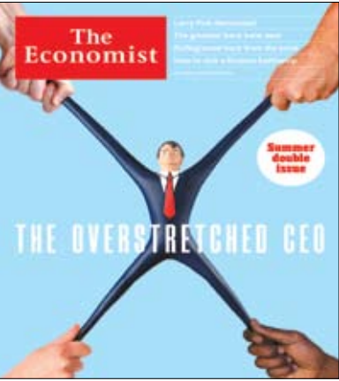
مدیران شرکت‌ها با قوانین سخت جدید از هر سو کشیده می‌شوند. تعداد

در هفته جاری از دیگر خبرهای حوزه کار تصویب آئین‌نامه اجرایی قانون مقاله‌نامه ایمنی و بهداشت شغلی از سوی هیأت وزیران بود. هیأت وزیران در نرسستی به پیشنهاد شورای عالی حفاظت فنی وزارت تعاون، کار و رفاه اجتماعی و به استناد تبصره ۲ ماده واحده قانون تصویب مقاله‌نامه ایمنی و بهداشت شغلی ۱۹۸۱(۱۳۶۰) (شماره