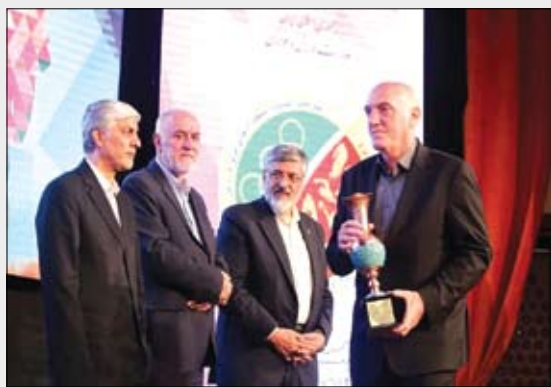
عصر آزادی / سرویس ورزشی: مراسم اختتامیه المپیاد استعداد های برتر کشور با حضور وزیر ورزش و جوانان و رؤسای فدراسیون ها برگزار شد...