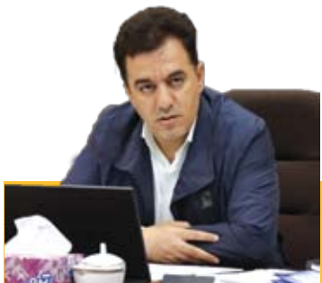
شهردار تبریز خبر داد: تبریز مبدأ ۴۰ درصد از صادرات ایران