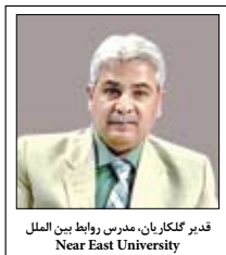
دبیر نگاربان، مدرس روابط بین الملل Near East University