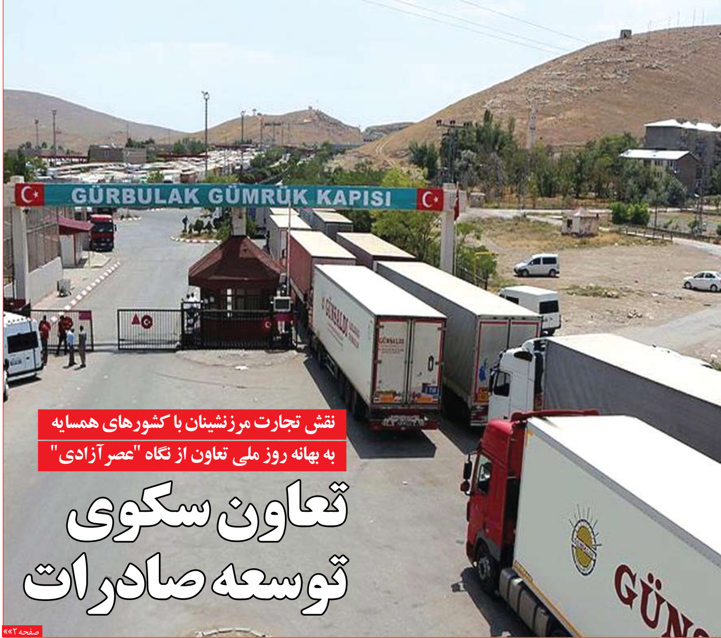
نقش تجارت مرزنیسان با کشورهای همسایه به بهانه روز ملی تعاون از نگاه "عصر آزادی"