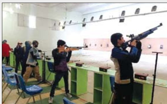
عصر آزادی / سرویس ورزشی: مسابقات انتخابی تیراندازی آذربایجان شرقی برای حضور در مسابقات استعدادهای برتر برگزار شد.