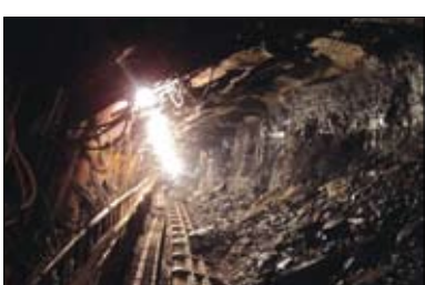
داده ۷۰۰ متر است و حادثه در عمق ۴۰۰ متری آن رخ داده است. انفجار در معدن زغالسنگ البرز شرقی طزره دامغان بر اثر تجمع گاز رخ داده است. در همین

رابطه ستاد مدیریت بحران استان به ایلنا اعلام کرد: هنوز علت دقیق ریزش معدن طزره که منجر به فوت کارگران گشته، مشخص نشده است. روابط عمومی پزشکی قانونی این استان نیز اظهار کرد: هنوز کالبد کارگران متوفی برای تعیین دقیق علت مرگ و گزارش آن بررسی نشده است. به نقل از یک منبع کارگری گفته می‌شود که این واحد معدنی تحت نظارت معادن زغالسنگ شرکت البرز شرقی فعالیت بهره‌برداری دارد. این منبع کارگری به ایلنا گفت: در چند سالی که از فعالیت این واحد معدنی می‌گذرد، نظارت بر فعالیت معدن بسیار کم بوده و پیش از این حوادث مشابهی در این معدن رخ داده است.