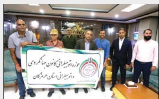
عصر آزادی / سرویس فرهنگی: جهانگردان هندی که سفر خود را از ایالت گجرات آغاز کرده اند، در مسیر خود به مقصد انگلستان، از بندرعباس وارد خاک ایران شدند.