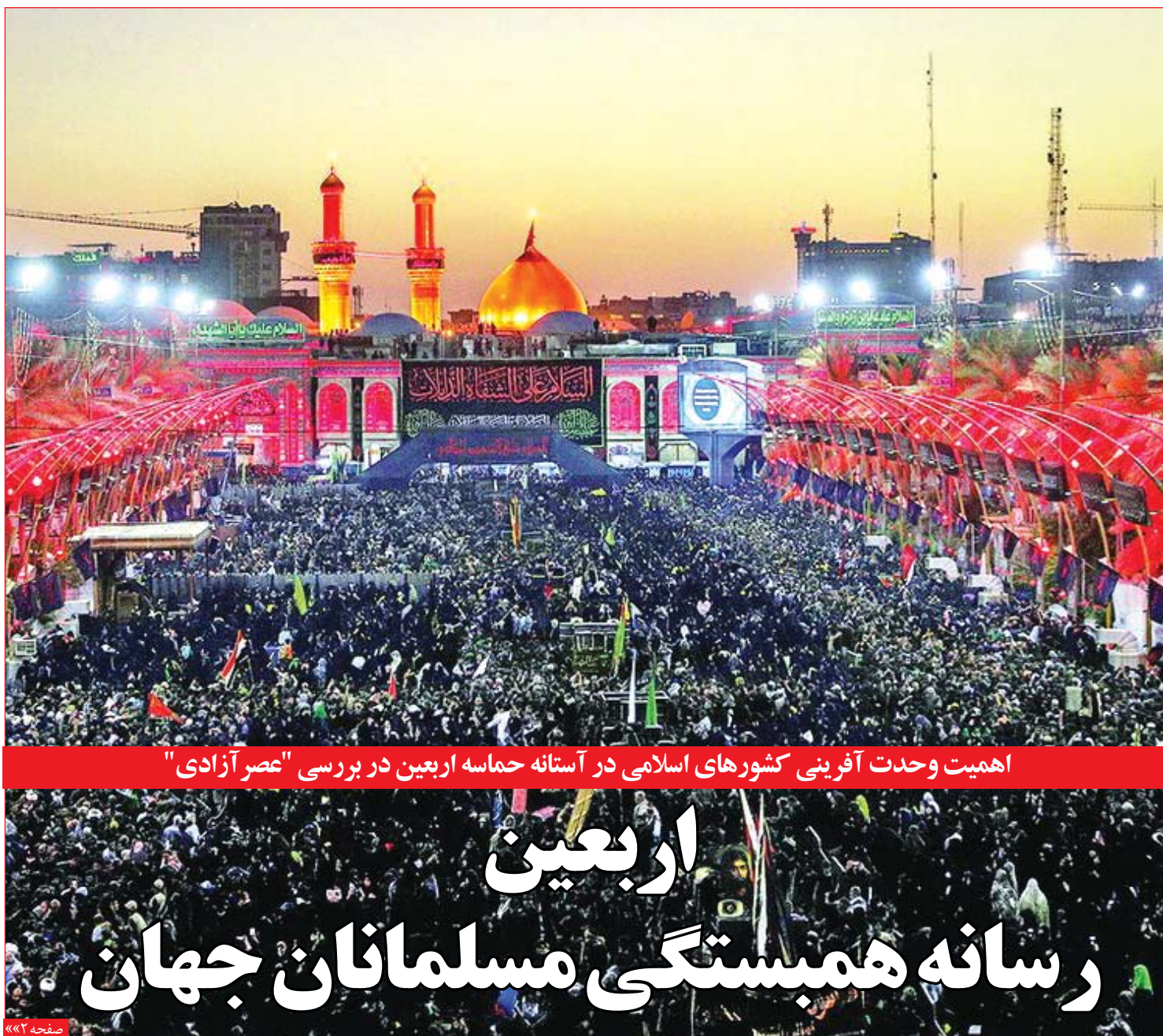
اهمیت وحدت آفرینی کشورهای اسلامی در آستانه حماسه اربعین در بررسی "عصر آزادی"