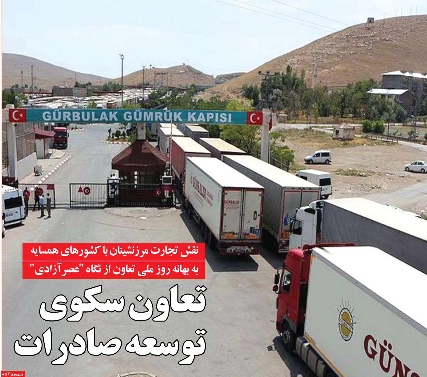
نقش تجارت مرزنیسان با کشورهای همسایه به بهانه روز ملی تعاون از نگاه "عصر آزادی"