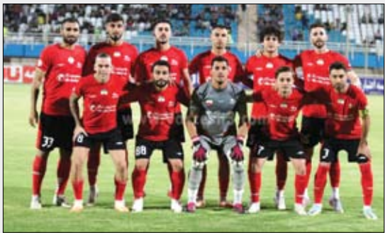
عصر آزادی / سرویس ورزشی: تیم تراکتور برابر استقلال خوزستان به برتری دست یافت...