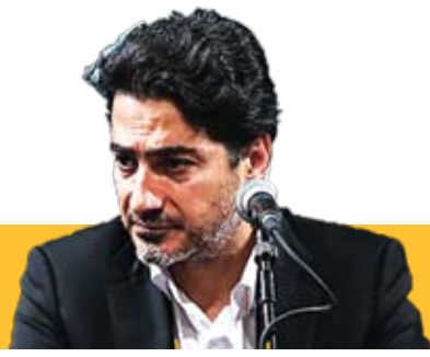
همایون شجریان: با نفس مردم زنده‌ام