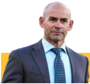
خمز: پیروزی ارزشمندی کسب کردیم