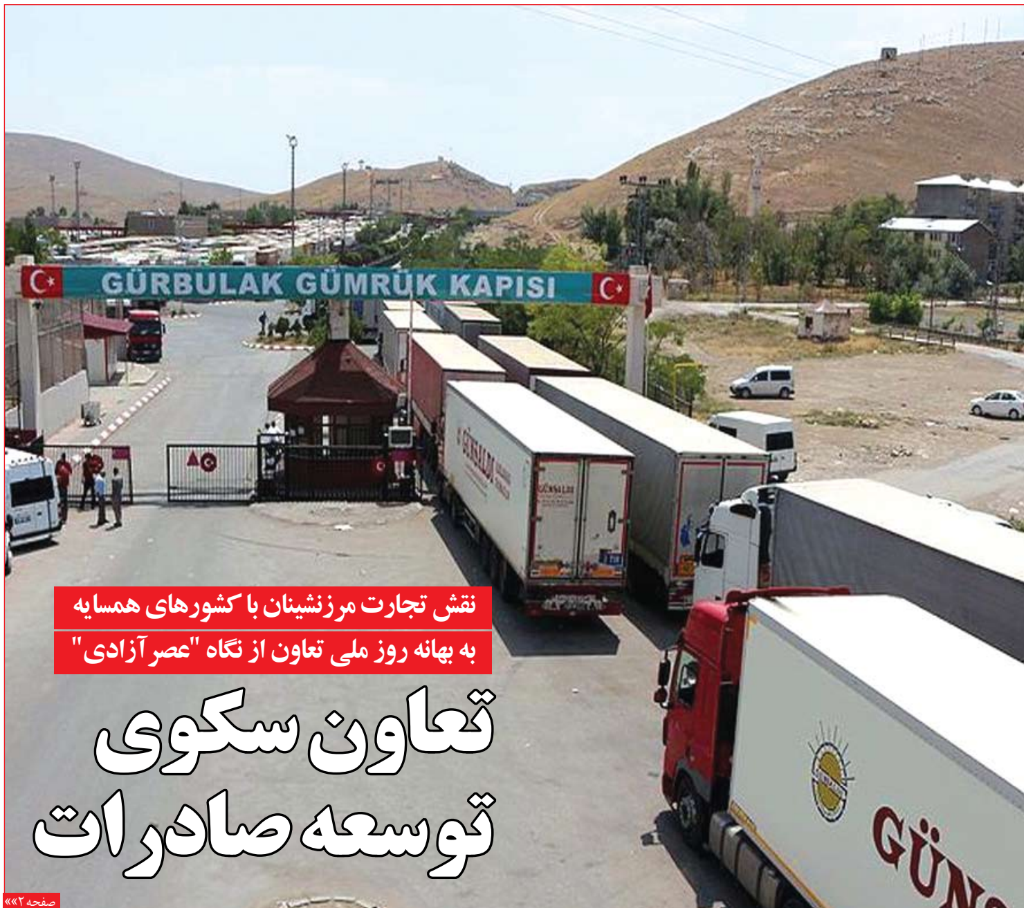
نقش تجارت مرزنیسان با کشورهای همسایه به بهانه روز ملی تعاون از نگاه "عصر آزادی"