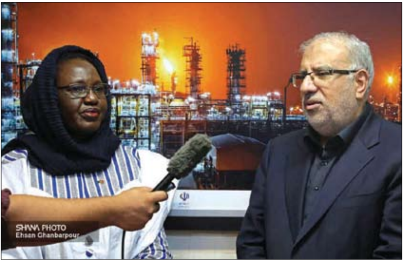
اوچی با بیان این که پیش از این نیز تفاهم‌هایی در تلاشیم تفاهم‌نامه دیگری که در گذشته میان دو کشور امضا شده است را تبدیل به قرارداد و

وزیر نفت گفت: مهندسان و متخصصان ایرانی آمادگی دارند با همکاری متخصصان بورکینافاسو در این کشور آفریقایی افزون بر صدور خدمات فنی و مهندسی، پالایشگاه نفت بسازند.