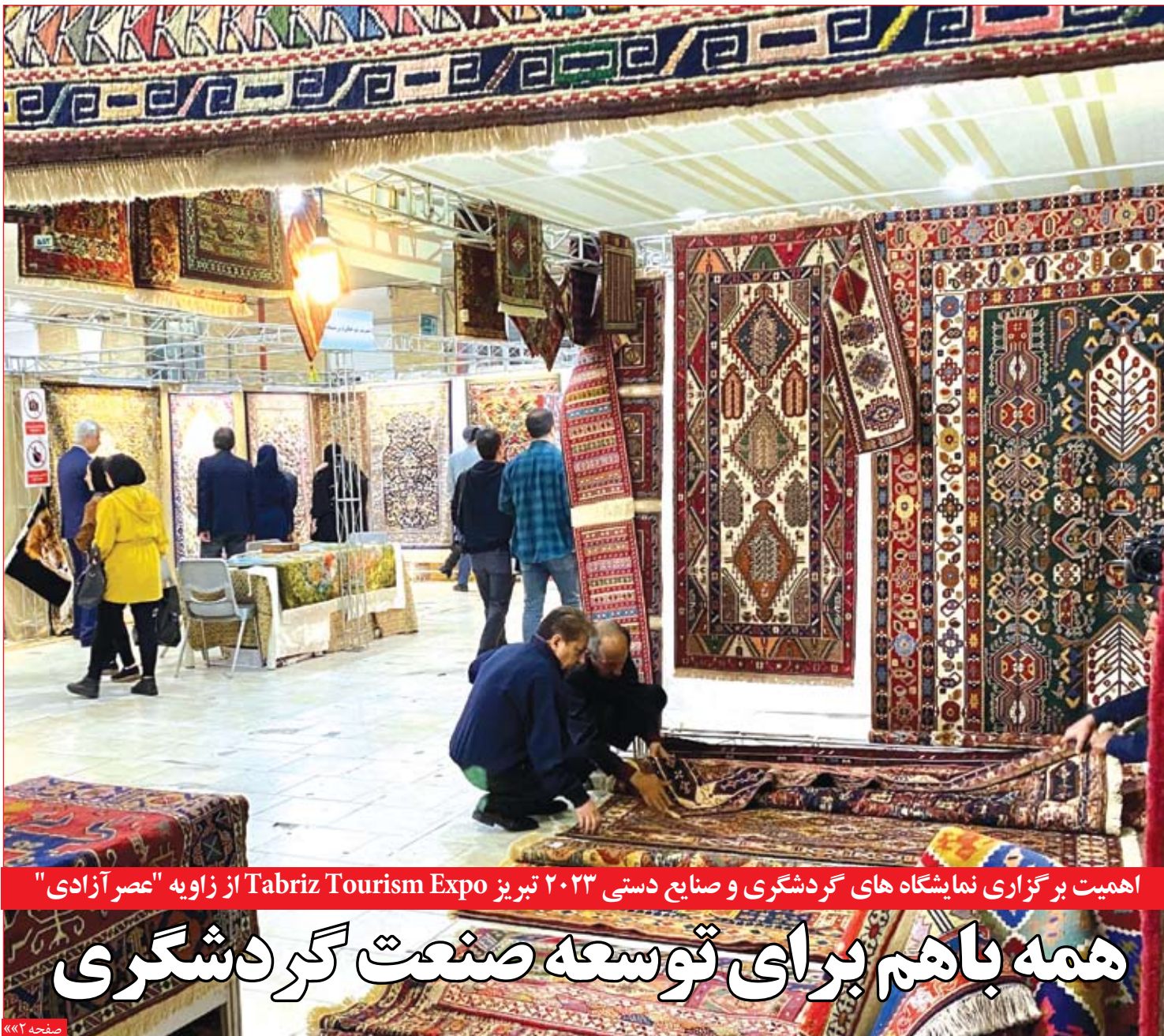
اهمیت برگزاری نمایشگاه‌های گردشگری و صنایع دستی ۲۰۲۳ تبریز Tabriz Tourism Expo از زاویه "عصر آزادی"