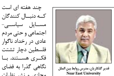
دبیر کلگزاربان مدرس روابط بین‌الملل Near East University

چند هفته‌ای است که دنبال‌کنندگان مسایل سیاسی-اجتماعی و حتی مردم عادی در رخداد ناگوار فلسطین دچار تشمت فکری هستند. با نگاهی گذرا به فضای مجازی و نشر نظرات خوانندگان در پایین هر تحلیل و یا خبری که از سوی سایت‌های خبری داخلی و خارجی قید می‌شود، نشان می‌دهد که عمده افراد جامعه در سطح جهان قطعاً تحت تأثیر اطلاعات نادرست قرار گرفته‌اند و به یقین نمی‌دانند که بی‌شک، اطلاعات نادرست در هر زمینه‌ای تأثیر منفی بر جامعه و سطح رفاه و آرامش روحی و روانی مردم دارد. این مشکل می‌تواند ضمن اینکه باعث دو قطبی شدن جامعه و حتی احزاب سیاسی شود، بستر لازم را برای نقض حقوق بشر فراهم می‌سازد. مدیران رسانه‌ها همیشه به نوعی با ضریب احتمال وابستگی به نهادهای سیاسی و قدرتی سیاسی را در راستای اهداف قدرتمندان سیاسی و اقتصادی دنبال می‌کنند که در نتیجه مردم احساس اضطراب با استرس می‌کنند. اطلاعات نادرست در هر واقع و یا تحریف شده می‌تواند بر توانایی افراد در کسب سلامت روانی عمومی، نگاه به حقایق در مسایل مرتب بر تغییرات اقلیمی و محیطی، حفظ دموکراسی و باثبات و موارد دیگر تأثیر بگذارد. ایجاد هرج و مرج در فرایندهای دموکراتیک، تعدیل هنجارهای لازم در درک آزادی‌های مدنی هم در کنار تضعیف اعتماد به نهادهای عمومی از جمله اهدافی است که در رسانه‌ها با داده‌های غیر واقع دنبال می‌شود.