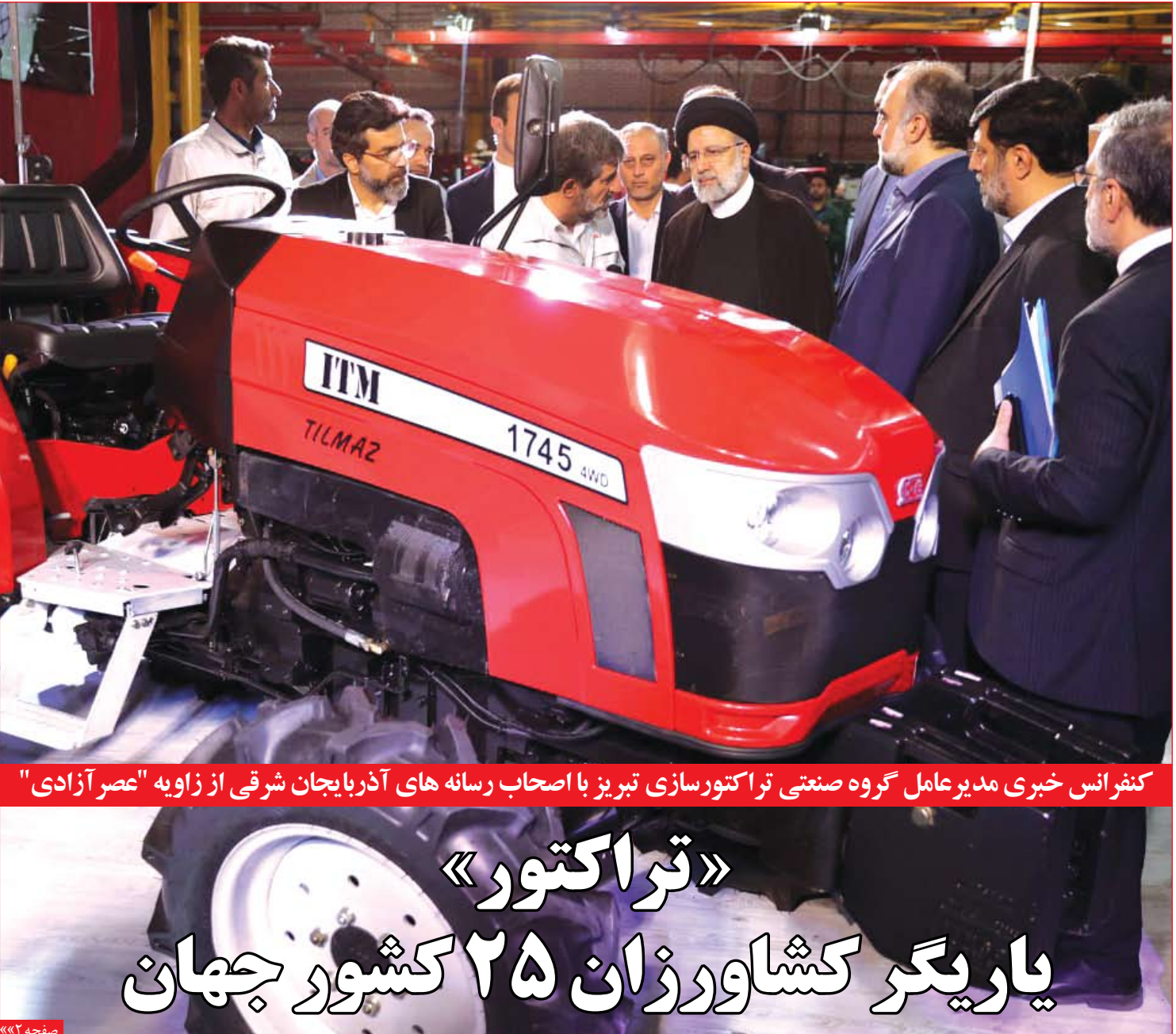
کنفرانس خبری مدیر عامل گروه صنعتی تراکتورسازی تبریز با اصحاب رسانه های آذربایجان شرقی از زاویه "عصر آزادی" «تراکتور» پاریگر کشاورزان ۲۵ کشور جهان

عصر آزادی / سرویس فرهنگی: نشست خبری نمایشگاه کارتون و کاریکاتور «آمریکای لاتین» پیش از ظهر روز سه شنبه ۹ آبان با حضور اصحاب رسانه در موزه هنرهای معاصر تهران برگزار شد.