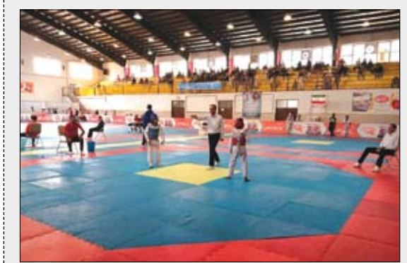
عصر آزادی / سرویس ورزشی: تکواندوکاران برتر نونهال آذربایجان شرقی معرفی شدند...

معرفی برترین های تکواندو آذربایجان شرقی در رده نونهالان