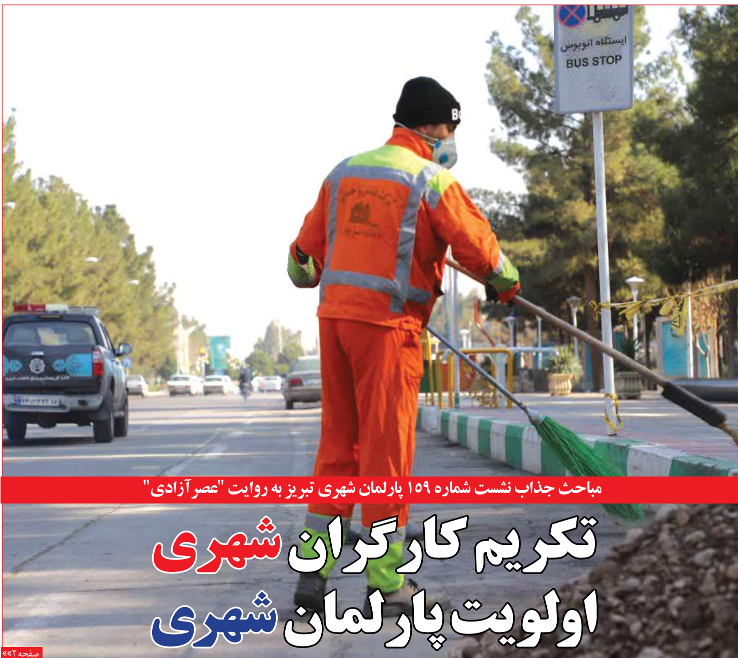
مباحث جذاب نشست شماره ۱۵۹ پارلمان شهری تبریز به روایت "عصر آزادی"