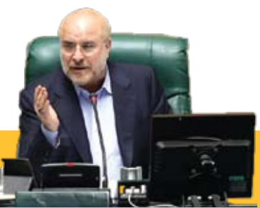
مردم توان پرداخت اقساط وام مسکن را ندارند