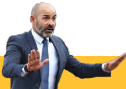
توپ تغییرات مریان تراکتور در زمین تماشاگران