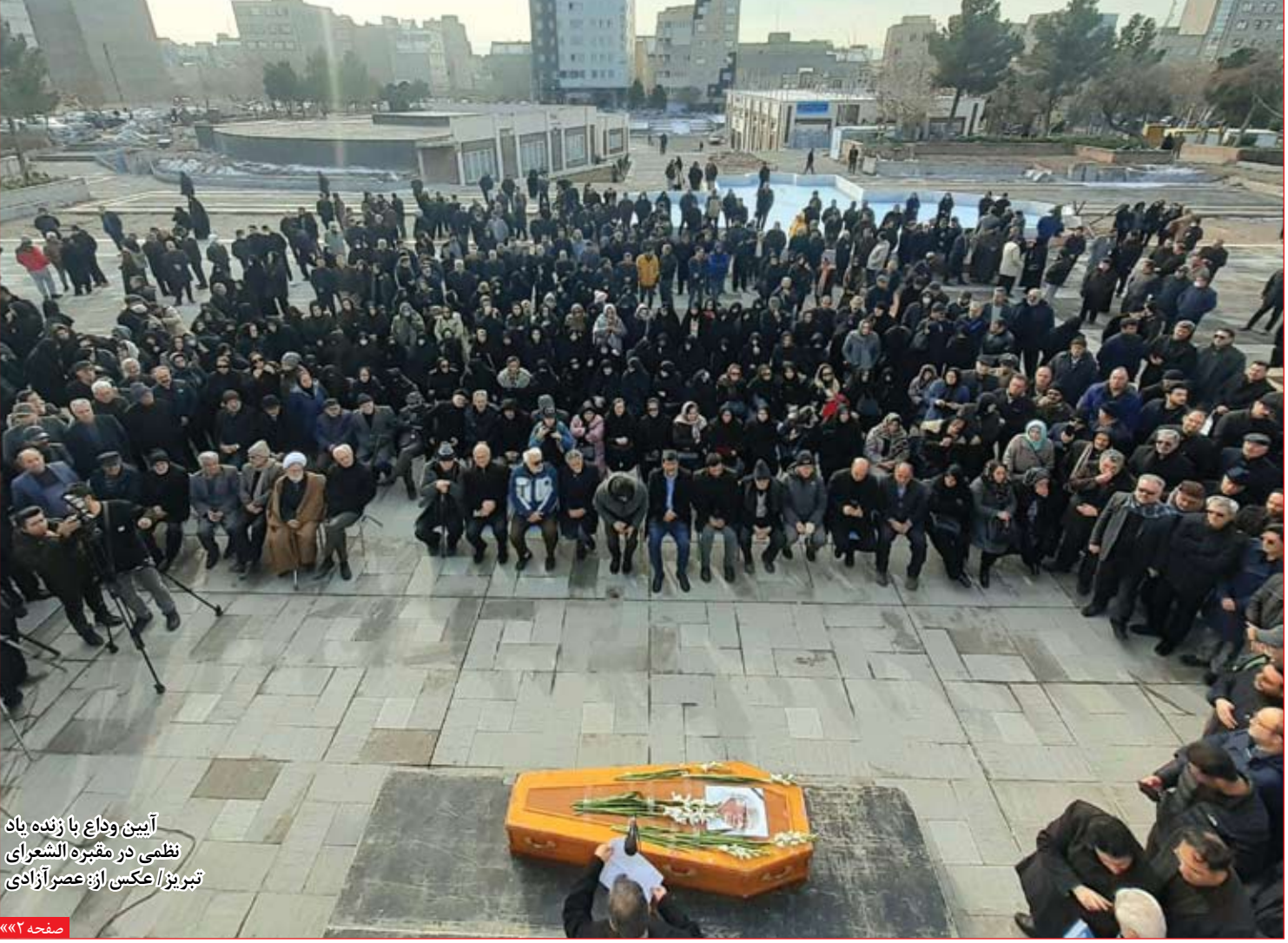
آیین وداع با زنده یاد نظمی در مقبره الشعراي تبریز