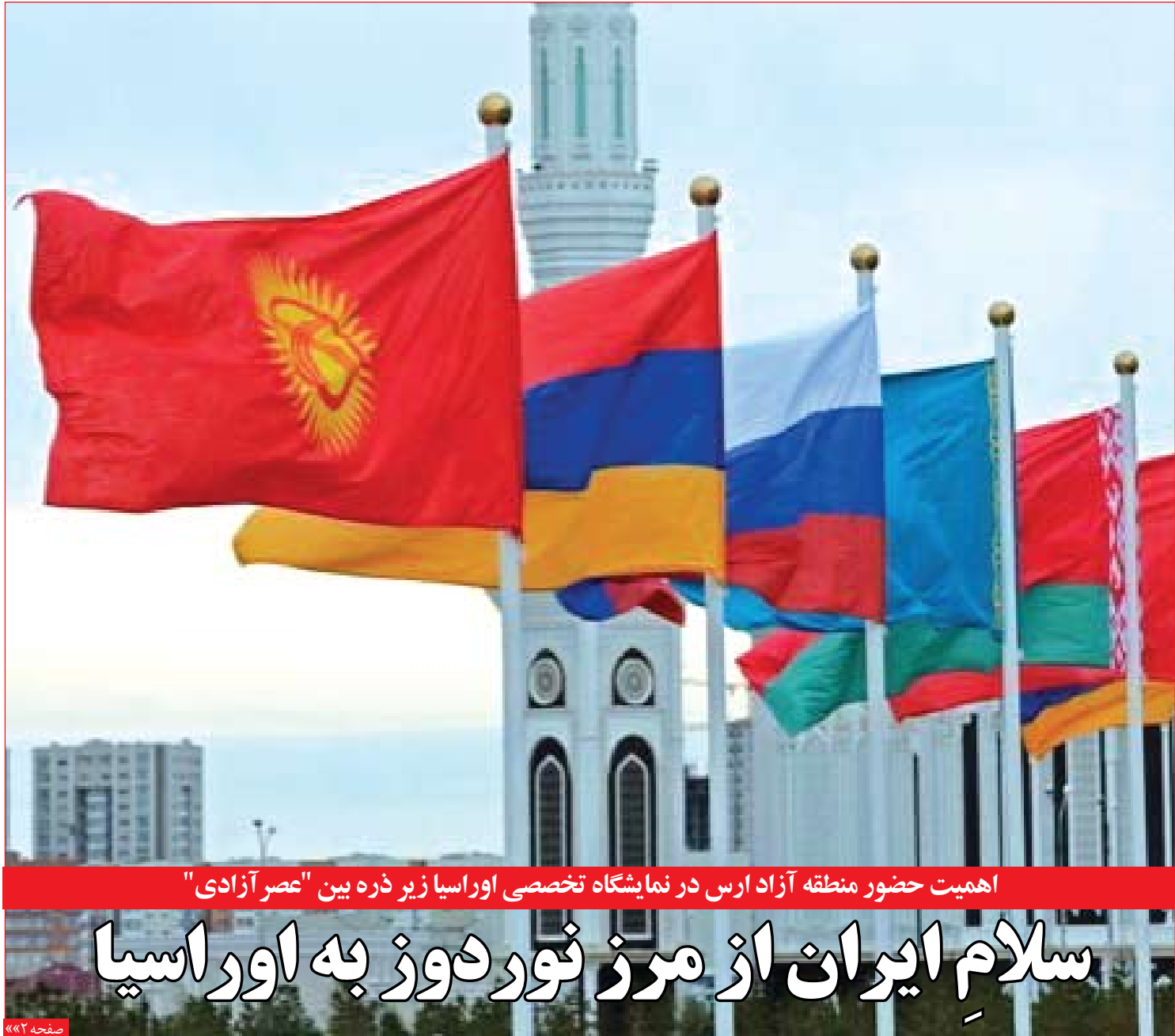
اهمیت حضور منطقه آزاد ارس در نمایشگاه تخصصی اوراسیا زیر ذره بین "عصر آزادی"