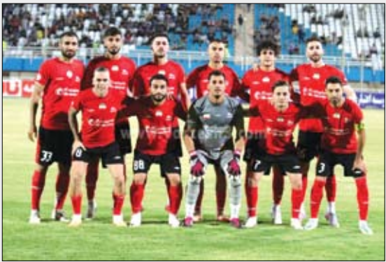
عصر آزادی / سرویس ورزشی: تیم تراکتور در هر بازی که گل دریافت نکرده به پیروزی دست یافته است...

در آیین تجلیل و تکریم واقفین رضوی استانه‌های غرب کشور در تبریز اعلام شد؛